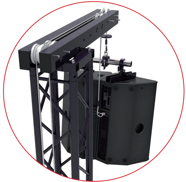
Multi-Umlenkrollen für Stahlseile oder Kettenzüge