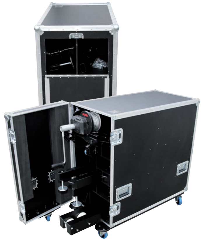
Flightcase für einen PA-Tower mit 120 x 60 cm Truckmaß