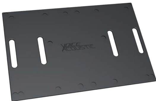
Stackingbrett mit Stapelmulden oder Gummimatte