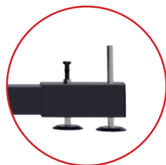
Aufsteckbarer Fußausleger mit langer Gewindespindel für mehr Verstellweg im Outdoor-Bereich